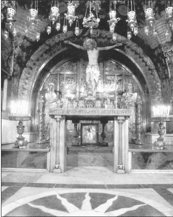
Ὁ Θεοτίμητος καί Φρικτός Γολγοθᾶς.

καί ἀγαλλίαση νά ἐορτάσουμε τήν ἔνδοξη καί σε- πτή Σου Ἀνάσταση. Ἀμήν.